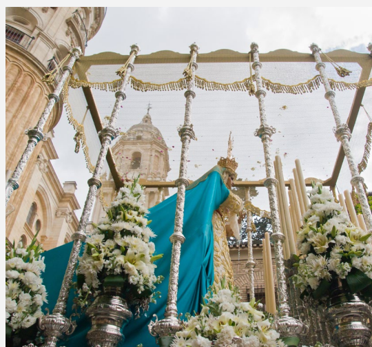
▲ SEMANA SANTA

Gracias a su clima suave podrás practicar actividades al aire libre como el golf, el senderismo o pasear a caballo por los pueblos de la sierra. Además, durante los meses de enero y febrero se celebra el Festival de Teatro de Málaga , una de las citas más importantes de las artes escénicas en la ciudad.