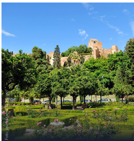
▲ JARDINES DE PEDRO LUIS ALONSO

Los jardines de Pedro Luis Alonso , de diseño latino, con influencia hispanoárabe y francesa, te esperan con sus naranjos, sus estanques y una bella rosaleda. Cerca, en la ladera sur del monte Gibralfaro, encontrarás los jardines de Puerta Oscura , que mezcla vegetación con fuentes, paseos, glorietas y terrazas.