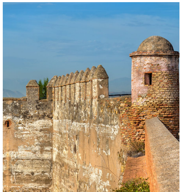
▲ EL CASTILLO DE GIBRALFARO

Para sumergirte en la historia de la ciudad desde la época romana hasta la actualidad, sigue la ruta de la Málaga monumental . Completa el itinerario con una visita al Castillo de Gibralfaro .