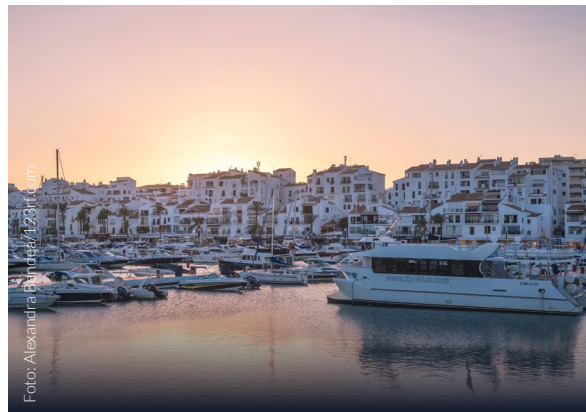
▲ PUERTO BANÚS MARBELLA