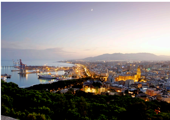
▲ VISTA AÉREA DE MÁLAGA

Sigue la ruta de la Málaga picassiana . Descubrirás el entorno de los primeros años de vida del pintor malagueño en su casa natal, que actualmente alberga el Museo Casa Natal de Picasso , visitarás lugares como la Escuela de Bellas Artes de San Telmo , donde su padre fue profesor de dibujo, y conocerás una importante muestra de sus obras en el Museo Picasso Málaga .