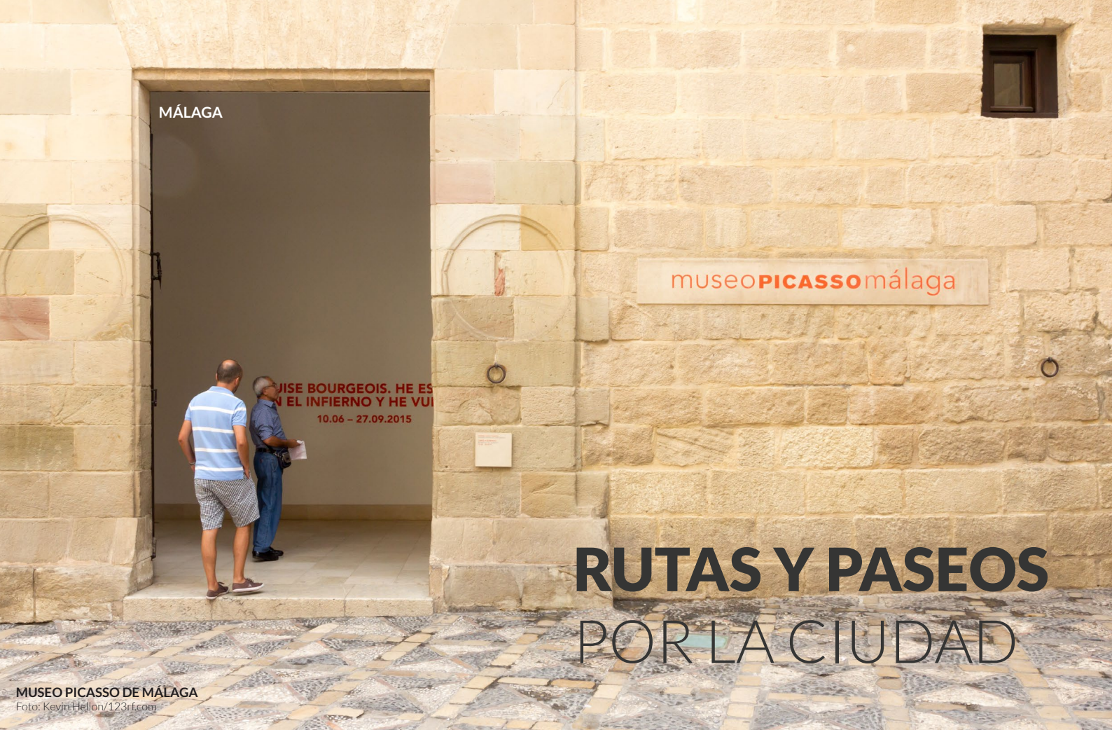
MUSEO PICASSO DE MÁLAGA