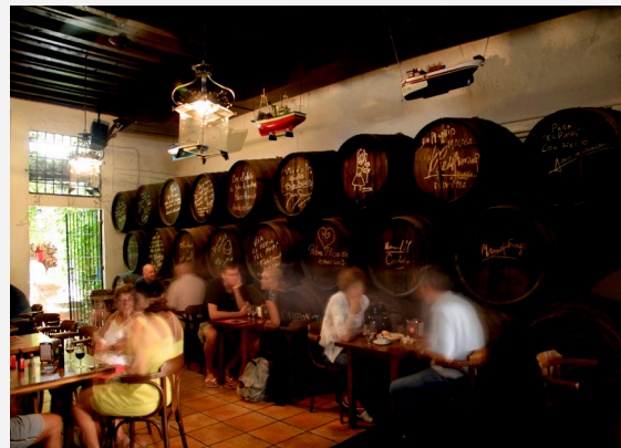
▲ BODEGA EL PIMPI

Recorre las calles desde la plaza de la Merced hasta la plaza de la Constitución , una de las principales zonas de marcha. Si prefieres espacios más relajados, visita La Malagueta , Muelle Uno o el paseo marítimo de Pedregalejo .