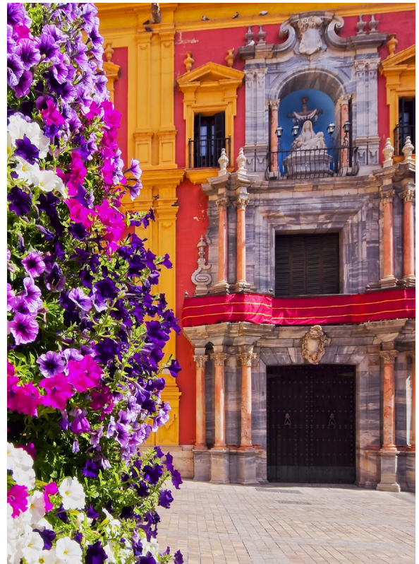
▲ PALACIO EPISCOPAL

Si te gustan las compras, en la calle del Marqués de Larios tienes las principales marcas de moda.